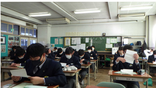
教室で手紙を読んでいる場面