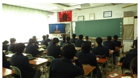
TV 放送を視聴している場面